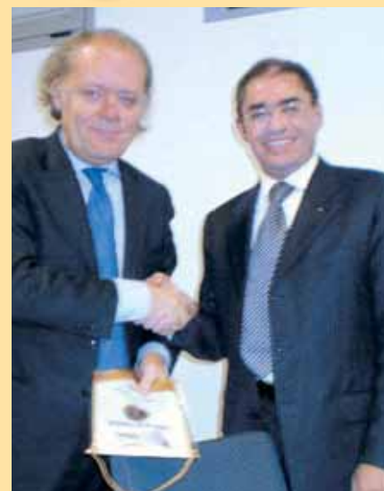
Il presidente Jacques Amara, consegna il guidoncino all'assessore regionale Renzo Marangon

I l convegno che abbiamo proposto nasce dal crescente interesse suscitato dalle trasformazioni degli strumenti urbanistici introdotti dalla regione Veneto nell'ultimo decennio. In particolar modo abbiamo voluto coordinare, stimolare e promuovere l'interesse collettivo nei confronti del piano territoriale regionale di coordinamento (PTRC), che costituisce il quadro di riferimento per orientare e coordinare l'attività di pianificazione sul territorio Veneto ai diversi livelli, in conformità con le indicazioni della programmazione socioeconomica regionale (Programma regionale di sviluppo - PRS). Questo è lo strumento che determinerà il buon governo della regione delineando gli obiettivi e le linee principali di organizzazione del territorio regionale, nonché le strategie e le azioni volte alla loro realizzazione. In particolare questo strumento si appresta a "disciplinare" le forme di tutela, valorizzazione e riqualificazione del territorio. Ci pareva giusto in una fase ormai cruciale, che vede il PTRC adottato dal consiglio lo scorso inverno e