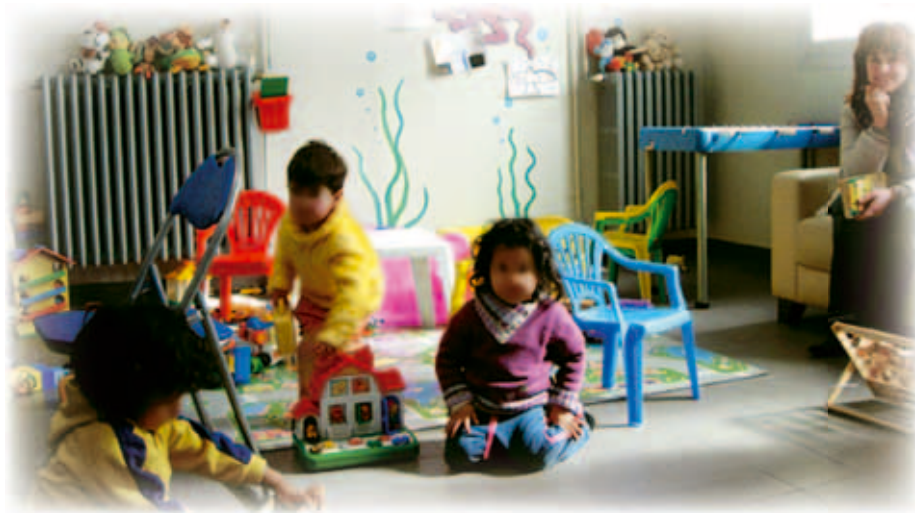
Angoli attrezzati della “Nursery” in questura per i piccoli immigrati

culturali che il club ha attuato. Siamo convinti che alzare muraglie, reali o virtuali, nel senso di affermare la priorità o la santità di una cultura o religione su un'altra non abbia mai portato a nulla di buono, se non ad incupire ed involvere i contesti dove si producevano. La superficialità con cui si condannano tutti gli islamici ha del fondamentalismo non meno