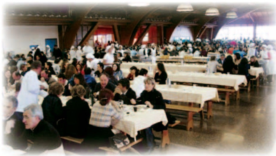
La sala mensa della comunità di San Patignano

giovanile” del Rosalba Carriera con il supporto del “Centro iniziative nuove di Padova per la tossicodipendenza”, trascorre senza particolari intoppi arrivando comunque, dopo oltre tre ore, a destinazione. La sosta a un Autogrill, per una comitiva di circa 50 persone, provoca un inevitabile rallentamento al programma