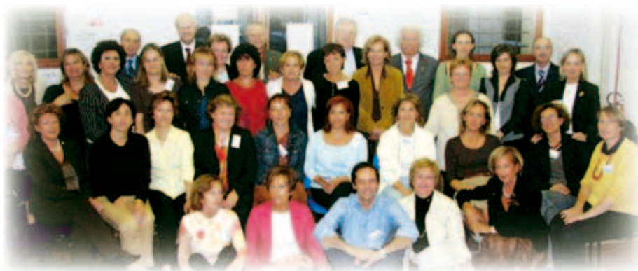
Il gruppo docenti partecipanti al Lions Quest, con le autorità lionistiche

S ul service Lions Quest e sui corsi realizzati abbiamo sempre relazionato per mettere al corrente del progredire dell'iniziativa e per comunicare, direi quasi confermare, il perseguimento degli obiettivi specifici programmati. L'apprezzamento da parte dei docenti partecipanti alla proposta formativa offerta dai Lions è sempre presente e noi lo accogliamo con soddisfazione e anche da questo, anzi soprattutto da questa valutazione positiva degli specialisti, rinnoviamo la nostra convinzione e le energie per continuare in questa corretta direzione. Il corso appare agli insegnanti un buon investimento del loro tempo e dell'impegno volontario che dedicano alla scuola e alla società. Sentono di ricevere delle cose importanti ed efficaci sul piano professionale e anche su quello personale (peraltro in un corso di questo tipo è difficile che non si verifichi questa sinergia). Quasi sempre queste considerazioni avvengono a livello di comunicazione verbale interpersonale; ci fa piacere anche registrare, per il valore documentario proprio della scrittura, una testimonianza rilasciata dalle corsiste. Di seguito riportiamo alcune delle riflessioni dalle insegnanti che hanno partecipato al corso che si è svolto a Dolo nei giorni 29, 30 settembre e 1°