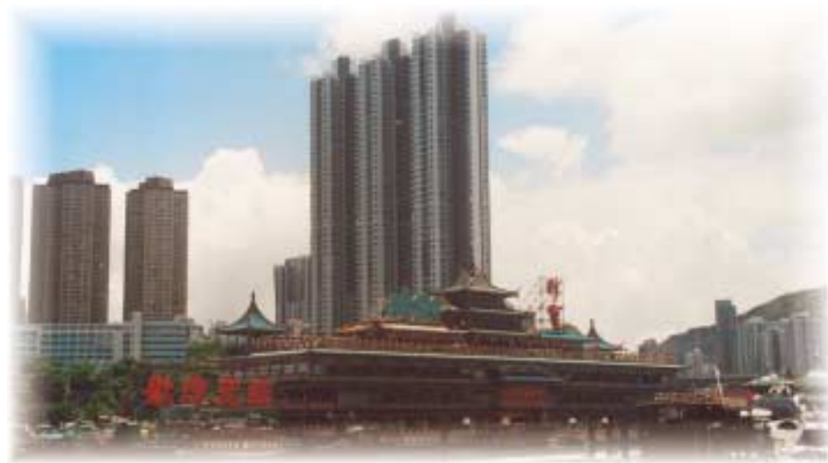
In copertina e sopra: Hong Kong sede della Convention 2005 del Lions Club International

TEMPO DI LIONS Notiziario dei Distretti 108 Ta1, 108 Ta2, 108 Ta3 della The International Association of Lions Club