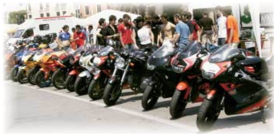
Gruppo motociclistico durante la manifestazione "Caschi in Prato" tenuta in Prato della Valle a Padova